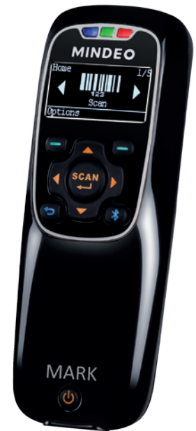
Протестировано и одобрено ЦРПТ

Под управлением CITYSOFT Lite Mindeo MS3690 Mark может осуществлять обмен данными с 1С и другими товароучётными системами. Программное обеспечение поддерживает все процессы маркировки и отслеживания в товароучётной системе.